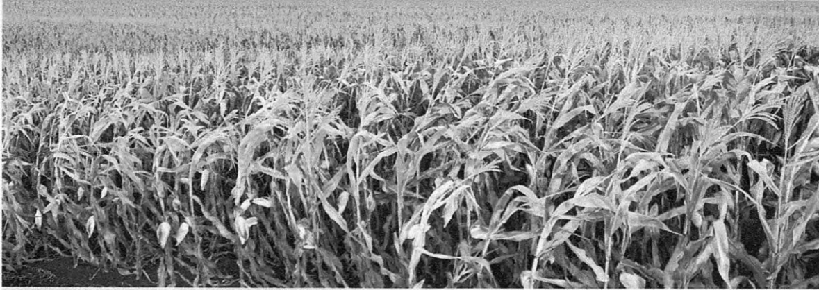
Perdas na safra de milho chegam a 30%, segundo previsão do Deral de Apucarana

Lavouras de milho e trigo são as mais afetadas pela falta de chuva; perdas já são irreversíveis, segundo o Deral, mesmo com possibilidade de mudança no tempo nesta semana